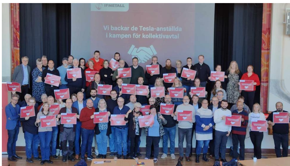
Gruppbild med deltagarna som manifesterade solidaritet med Tesla-arbetarna

”Deltagarna fick också möjlighet att göra inspel till partiets nationella organisatoriska grupp som arbetar med att framföra förslag om hur fler partiets ska rekrytera fler fackliga medlemmar och få fler fackliga förtroendevalda.”