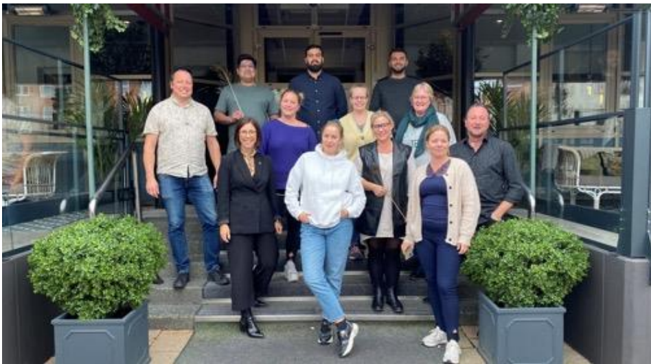
Deltagarna på Backagårdsakademin (bild: LO-medlem på plats)

Syftet med utbildningen är erbjuda deltagarna fördjupad förståelse i metoder, teorier och pedagogiska verktyg. Utveckla den livskraftiga folkbildningen, politiska- och fackliga folkrörelsearbetet för att stärka möta våra utmaningar. Höja kunskapsnivån inom opinionsbildning och demokratiutveckling. Gemensamt utveckla den skånska arbetarrörelsen som en folkrörelse i vår samtid och framtid.