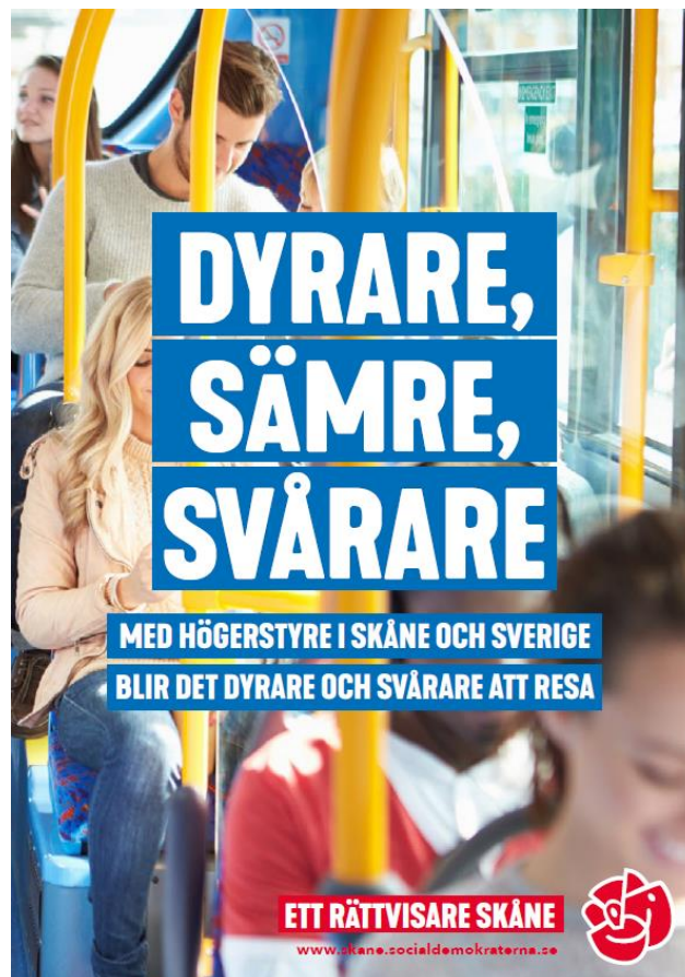
Ett av flygbladen som använts under årets kampanjer

Särskilt genomslag fick initiativ för en bättre kollektivtrafik, både för en namninsamling med 14 000 personer som protesterade mot regionstyrets prishöjningar och initiativ för en tätare tågtrafik på det nya dubbelspåret mellan Förslöv och Maria station i Helsingborg.