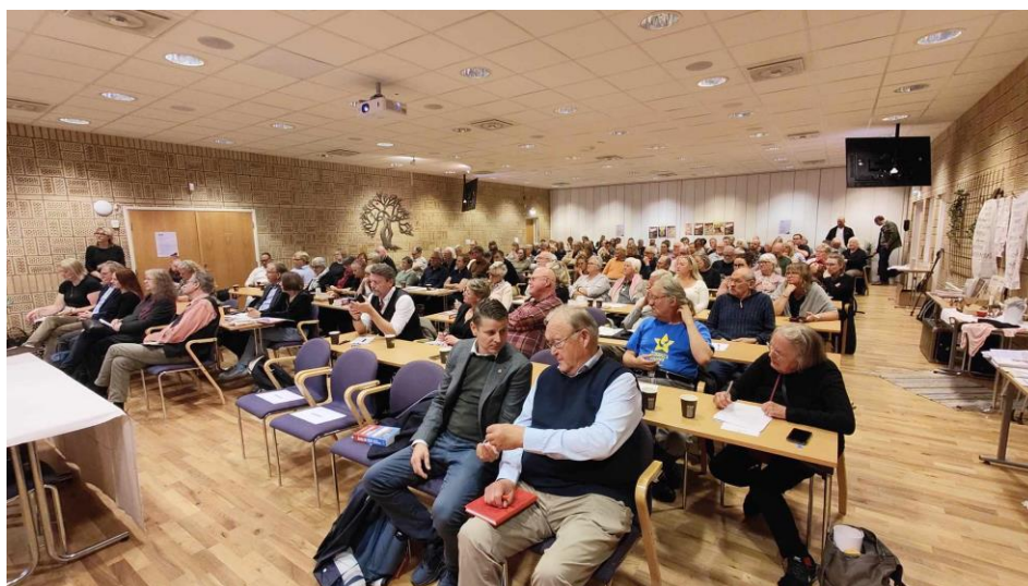
Fullsatt på Backagården

Övergripande syfte var hur vi skriver vår historia och vem som skriver vår historia. Hur våra olika organisationer i arbetarrörelsen kan hjälpas åt i framtiden samt att vidareutveckla tidigare genomförda konferenser.