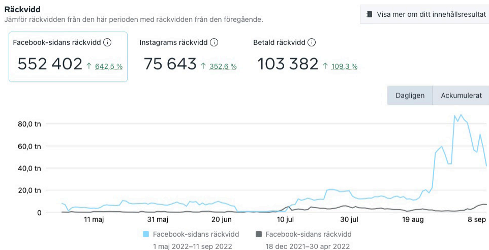
Figur 6. Räckvidd på Facebook från 1 maj till 11 september.

den perioden. När det gäller partidistriktets Instagram var räckvidden 54 423 personer under samma tidsperiod. I slutspurten, det vill säga de två sista veckorna, var räckvidden mellan 50 000 och 80 000 personer per dag på Facebook och mellan 7 000 och 12 000 på Instagram.