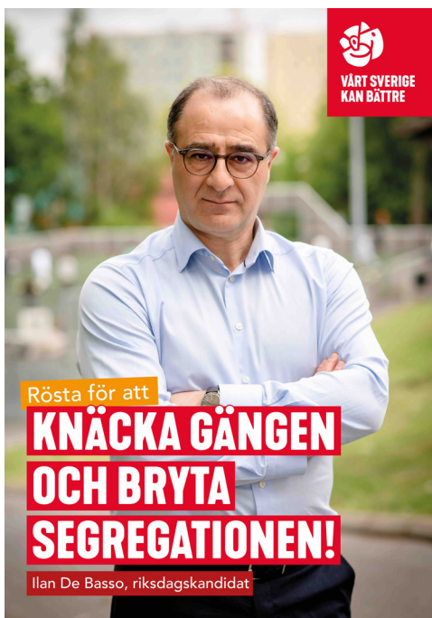
Exempel, affisch prioriterad kandidat.