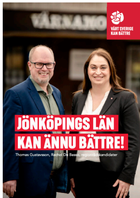
Folder Lilla valrörelsen.