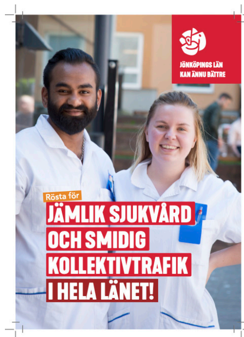
Folder prioriterade frågor sjukvård.